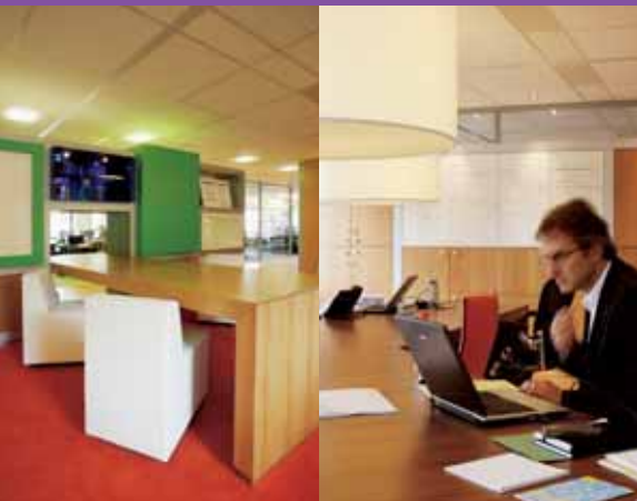
APS IT diensten

HUISELIJKHEID STOND BOVENAAN HET WENSENLIJSTJE VAN APS OMDAT VEEL ADVISEURS VAAK ONDERWEG ZIJN OF THUIS WERKEN.