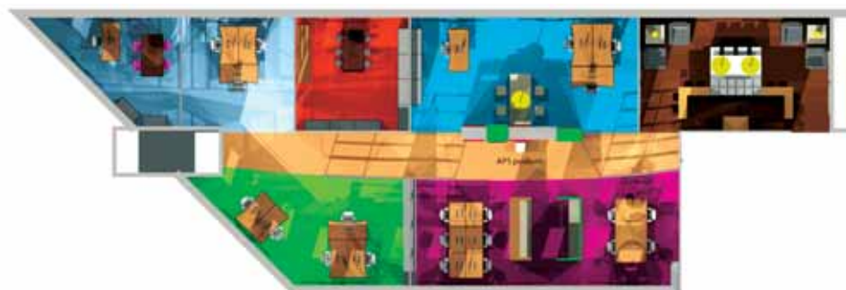
APS IT diensten Wisselwerkruimte Overleg/presentatie