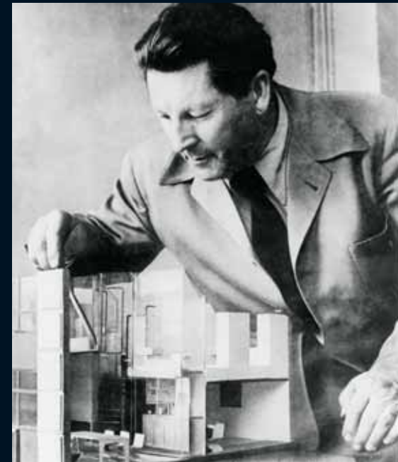
GERRIT TH. RIETVELD MET MAQUETTE VAN KERNWONING

De Mondial was ontworpen als een stapel- en koppelbare stoel met een grijs gelakt geprofileerd plaatstalen frame en een aluminium zitkuij. Het ontwerp van Rietveld was even sober als innovatief. Het was, zo betoogt Ida van Zijl in 'Mondial - Gispens en Gerrit Th. Rietveld', het eerste ontwerp van Rietveld dat daadwerkelijk als industrieel product kon worden ontwikkeld. Gispens maakte twee prototypes (een mét en een zonder armleggers), die in mei 1957 in het tijdschrift 'Goed Wonen' werden gepresenteerd. De stoel werd rond die tijd ook in het Stedelijk Museum getoond, omdat de Mondial samen met andere ontwerpen was geselecteerd voor de Nederlandse inzending op de XIde Triënnale in Milaan. De Mondial werd in Milaan onderscheiden met een gouden medaille. In 1958 besteedde het tijdschrift 'Goed Wonen' opnieuw aandacht aan Rietvelds ontwerp. De conclusie was voor 'Goed Wonen' duidelijk. 'Hier is de droom van 1928 werkelijkheid geworden. Hier heeft hij [Rietveld] geholpen 'het leven te vereenvoudigen'.