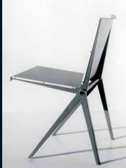
HET PROTOTYPE VAN DE MONDIALSTOEL MET ALUMINIUM ZITKUIP ZONDER ARMLEGGERS

Het Atomium in Brussel gold als symbool voor vreedzaam gebruik van kernenergie. Rietvelds stoel kreeg niet voor niets de naam Mondial: het was zijn stoel 'voor de wereld'.