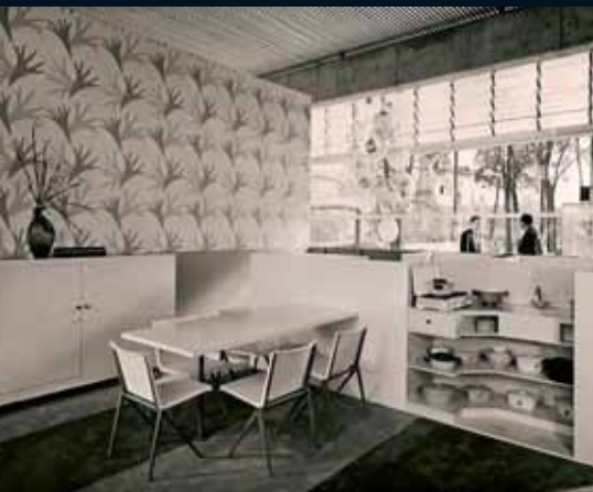
VIJF MONDIAL STOELN IN WIT POLYESTER OP DE AFDELING MODERNE WONINGINRICHTING IN HET NEDERLANDS PAVILJOEN, WERELDTENTOONSTELLING BRUSSEL 1958

Vanwege de heruitgave van Rietvelds ontwerp, is ook de geschiedenis van de Mondial in kaart gebracht. In het boek 'Mondial – Gispens & Rietveld' doen Sylvia van Schaik (conservator van de Stichting Collectie Gispens) en Peter C. Wever verslag van hun onderzoek. De Mondial stoel werd speciaal ontworpen voor gebruik in het Nederlands paviljoen op de Wereldtentoonstelling die in 1958 in Brussel werd gehouden. Het was de eerste na-oorlogse Wereldtentoonstelling die door bijna 42 miljoen mensen werd bezocht. Het centrale thema was 'Balans van de wereld voor een humaner wereld'.