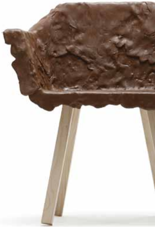
AMATEUR MASTERS A, 2011 JERSZY SEYMOUR

JERSZY SEYMOUR (1968) ONTWERPER, DOCENT, TEGENDRAADS DENKER > STUDEERDE INDUSTRIEEL DESIGN AAN HET ROYAL COLLEGE OF ART, LONDEN > BEGON EIGEN STUDIO IN MILAAN MET EXPERIMENTELE EN CONCEPTUELE PROJECTEN > WERKTE VOOR O.M. MAGIS, VITRA, KREI, MOULINEX EN IDEE > SEYMOUR'S ONTWERPEN WAREN TE ZIEN OP TENTOONSTELLINGEN IN HET DESIGN MUSEUM IN LONDON, VITRA DESIGN MUSEUM IN BASEL AND BERLIJN, HET PALAIS DE TOKYO IN PARIJS > ZIJN OPGENOMEN IN COLLECTIES VAN HET MUSEUM OF MODERN ART, NEW YORK, HET FONDS NATIONAL DE ART CONTEMPORAIN FRANCE AND HET MUSEE D'ART GRAND-DUC JEAN IN LUXEMBURG > FINANCIERT MET DE OPBRENGST VAN DE AMATEUR MASTERS-SERIE EEN EIGEN ONOFFICIEEL DESIGNSCHOOLTJE > WIL ZO EEN NIEUWE KLEINSCHALIGE ECONOMIE OPBOUWEN <