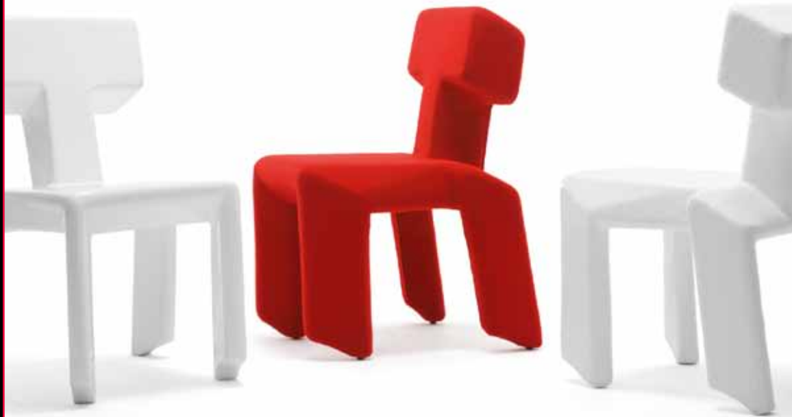
STUBBORN CHAIR, 2010 STUDIO MAKKINK & BEY

Matière: polyester. Couleur: lisse et rugueux en blanc Tapisée: en différentes couleurs (Kvadrat)